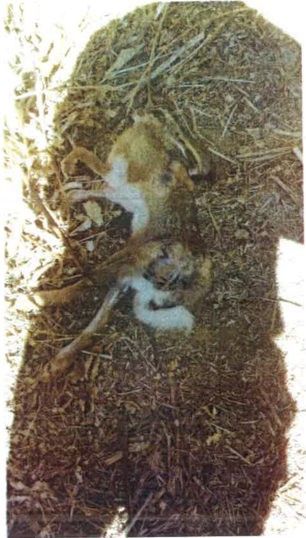
SLC LA CODORNIZ ( TM GÉVORA)